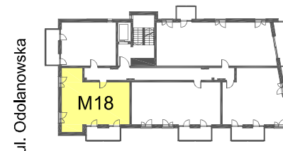
SCHEMAT LOKALIZACJI MIESZKANIA W BUDYNKU